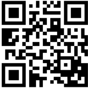
FRAGMENT 'Het joenk is aan 't versmachten'